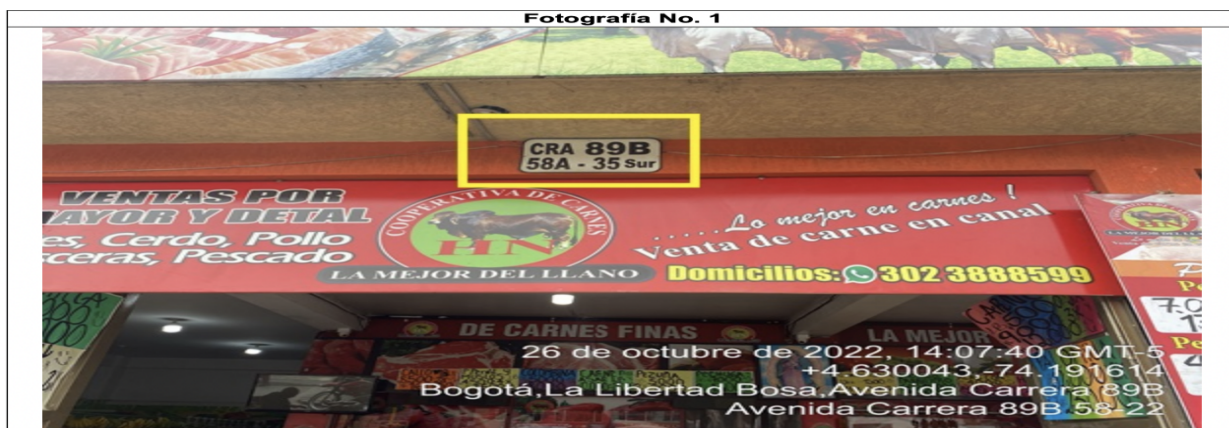
En la cual se evidencia la nomenclatura donde se encuentra ubicado el establecimiento comercial COOPERATIVA DE CARNES LA MEJOR DEL LLANO HN en la CR 89 B No. 58 A - 35 Sur, de la localidad de Bosa.

Al momento de realizar la visita técnica se solicitó a la persona que se encontraba en el establecimiento comercial el registro previo y vigente de Publicidad Exterior Visual ante la Secretaría Distrital de Ambiente, registro que no presentó, manifestando que no se encontraba en disposición de atender y firmar el acta de visita como quedó registrado en las observaciones del acta de visita técnica No. 205043 del 26 de octubre de 2022.