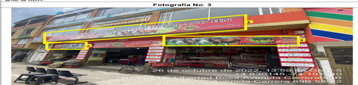
En la cual se evidencian tres (3) elementos tipo aviso en fachada pertenecientes al establecimiento comercial COOPERATIVA DE CARNES LA MEJOR DEL LLANO HN, los cuales son adicionales al único elemento permitido por fachada de establecimiento comercial.